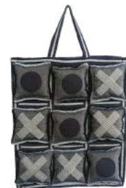
Produto brinde feito com upcycle de resíduos da GMT