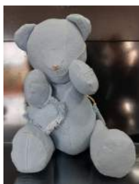
Bicho de pelúcia feito com calças paradas no estoque da empresa