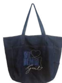
Bolsa feita com tecidos do estoque da empresa